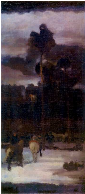
Biwak powstańców w lesie. 1873-1874.