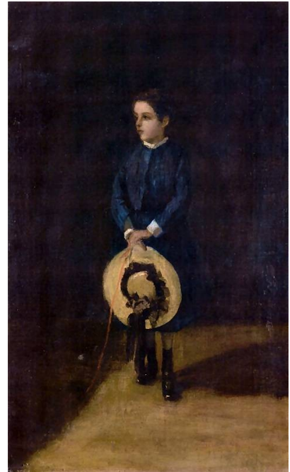
Dziewczynka z kapeluszem. 1874. Bracia Albertyni, Kraków.