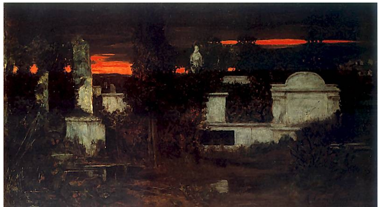
"Cmentarz włoski" Adam Chmielowski, "Cmentarz włoski" 1880 r., MN w Krakowie.