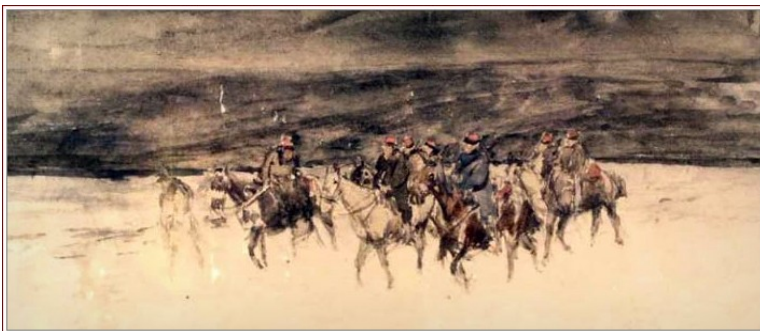
Obraz Adama Chmielowskiego "Powstańcy" ok.1875-1877.):