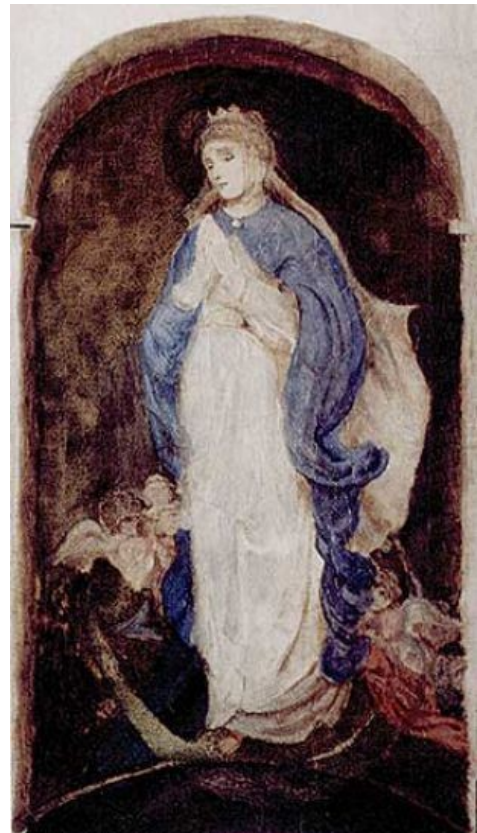
Adam Chmielowski, "Niepokalana" zbiory Zgromadzenia Sióstr Albertynek, Kraków.