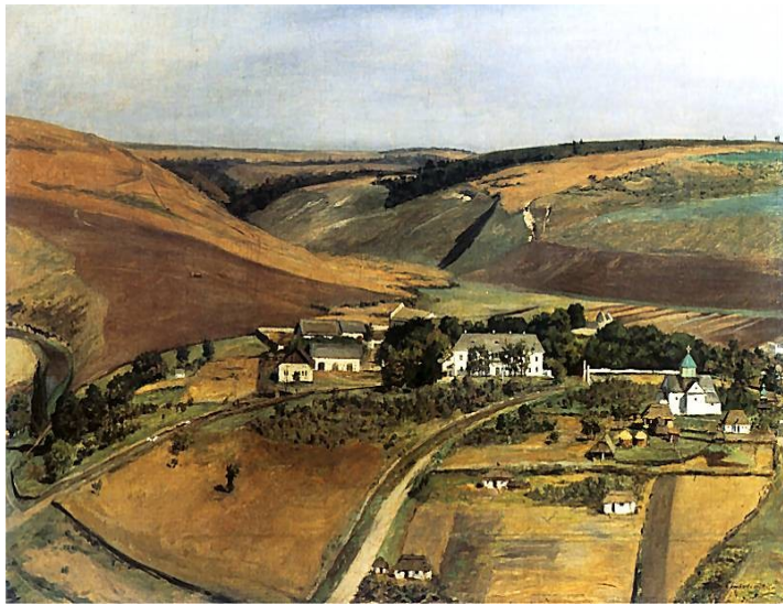
Adam Chmielowski, "Zawale" 1883 r., MN w Krakowie.