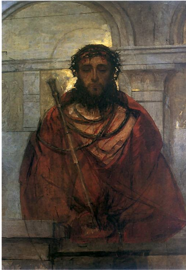
"Ecce Homo" Adam Chmielowski, "Ecce Homo" 1881 r., Kaplica Sióstr Albertynek pod wezwaniem Ecce Homo, Kraków.