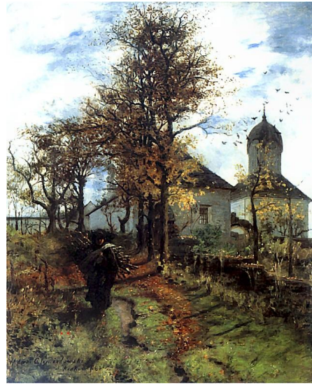
Opuszczona plebania. 1888. Muzeum Narodowe, Warszawa. .